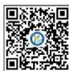
招生办公室微信公众号