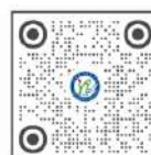
招生办公室小红书