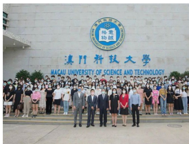
澳科大 2022 秋季学期交流生合影