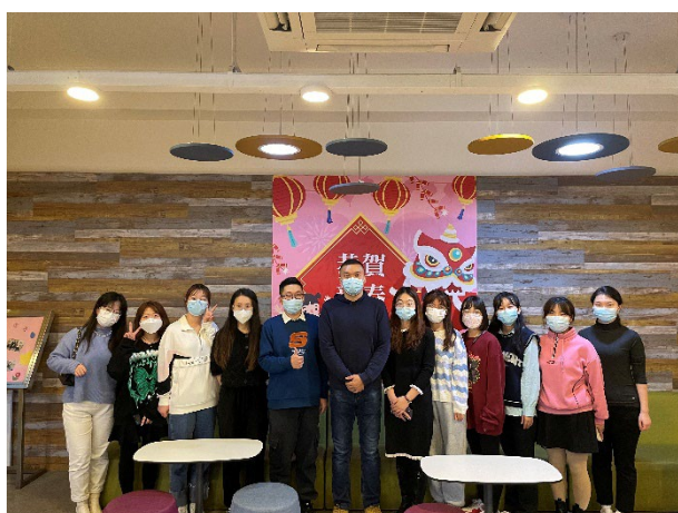
宁夏医科大学赴澳科大交流生心得分享会