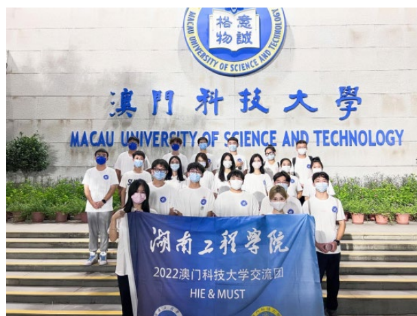
湖南工程学院赴澳科大交流生合影