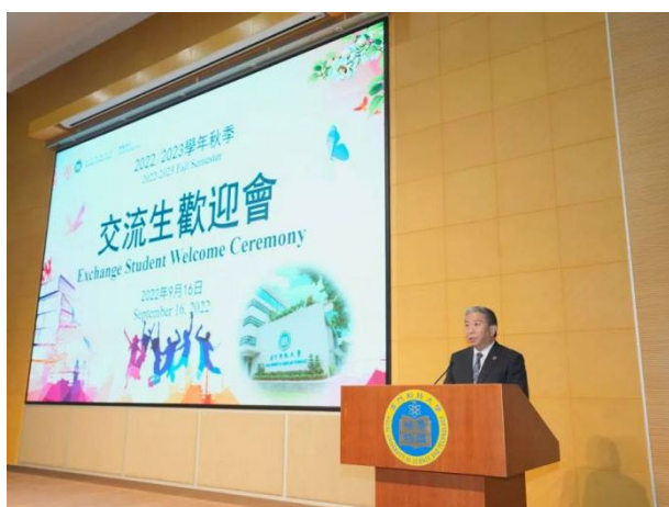
澳科大 2022 秋季学期交流生欢迎会